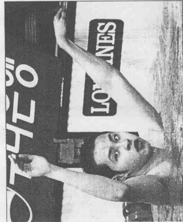
↑ 韓國代表隊與亞運亞今年是也，錄世界破泳蛙百兩在介康島北本日。舉創 (透路)