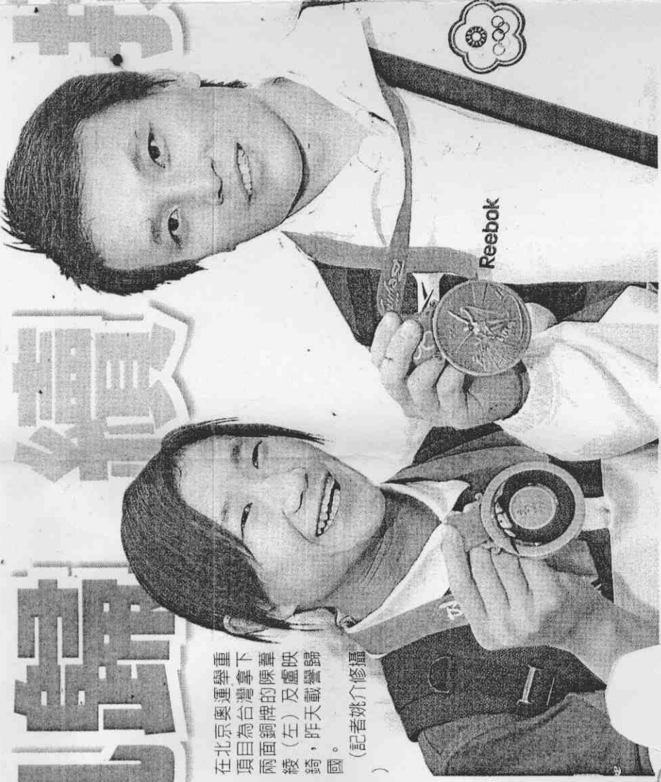
台灣體育大學的師生高舉歡迎布條，在桃園機場歡迎勇奪銅牌的舉重雙妹。