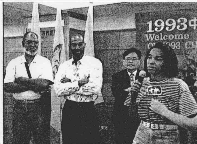
↑奧運金牌女將亞斯福（右）很高興來華參賽。