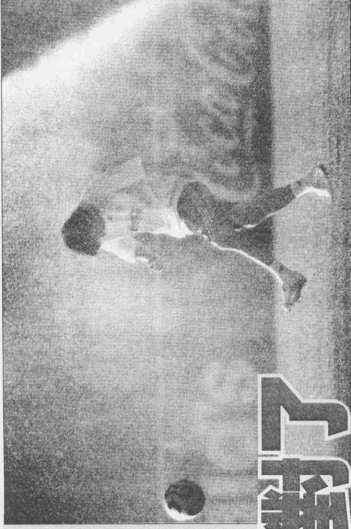
►阿根廷球員梅西例行練球時，用水柱降溫，以抵擋烈日的曝曬。

從英格蘭和荷蘭兩隊首戰的表現來看，兩支西歐勁旅明顯不適應下午的比賽，兩隊雖然贏球，但踢球的勁道似有不足，尤其在取得領先後，似乎刻意有所保留，這究竟是戰略上的調整，還是天候的影響頗耐人尋味。