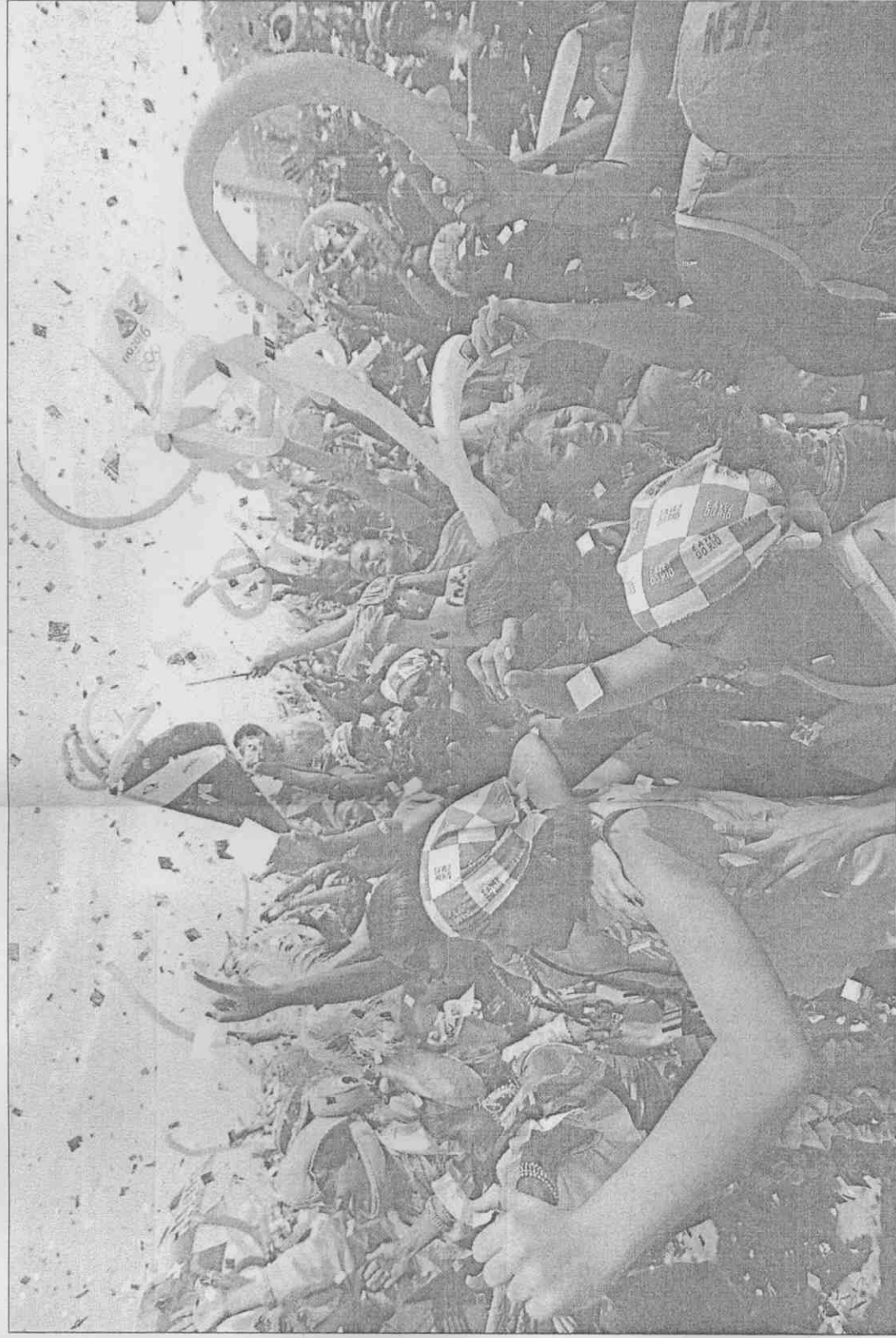
里約奧運 我們來了

這一波金融危機發生時，巴西代表開發中國家，在國際上爭取更大的發言權與決定權，進而提高20國集團與新興市場集團BRIC（巴西、俄羅斯、印度、中國四大經濟體）的地位。而在晉南美爭取第一個奧運主辦權時，魯拉以相同的論調表示，主辦權向來落在富國手上，該給其他國家機會，成功為巴西爭取到另一個表現的舞台。