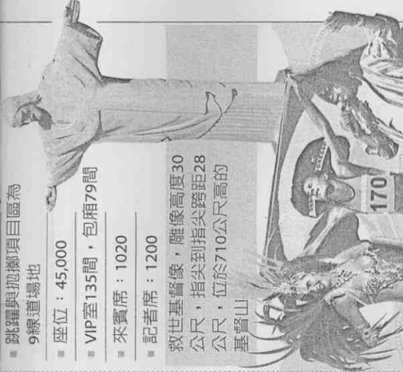
製表／王麗娟 ■ 聯合報

■ 跳躍與拋擲項目區為 9線道場地 ■ 座位：45,000 ■ VIP室135間，包廂79間 ■ 來賓席：1020 ■ 記者席：1200