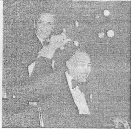
法蘭克辛納屈在一九七八年為喬路易推輪椅。

喬路易窮困不堪，可是一直有愛他的女子支持他。一九五五年耶誕節，他娶了在哈林區作美容生意很成功的露絲摩根。起初，露絲負責兩人生活的所有開銷。可是，喬路易旅行太多，回到家，不是睡覺就是白天整天打高爾夫，或整晚歡宴。露絲摩根受不了，一九五七年夏天，婚姻破裂。