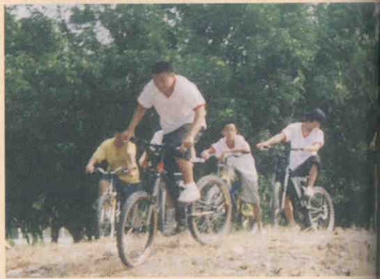
▲藉由地區的資源規劃辦理的自行車夏令營。

(三)參與對象，考慮活動適合青少年來進行，因此活動的推展以學生為主體。自行車運動之推展及籃球運動推廣為水里國中推動運動發展的重要兩個項目，在推動的過程中，不僅帶動了運動風氣，更將體委會此次的「運動人口倍增計