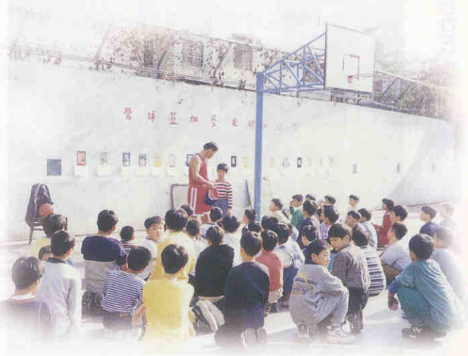
▲藉由教練之規則說明，使小朋友不僅會玩而且更能遵守規則。