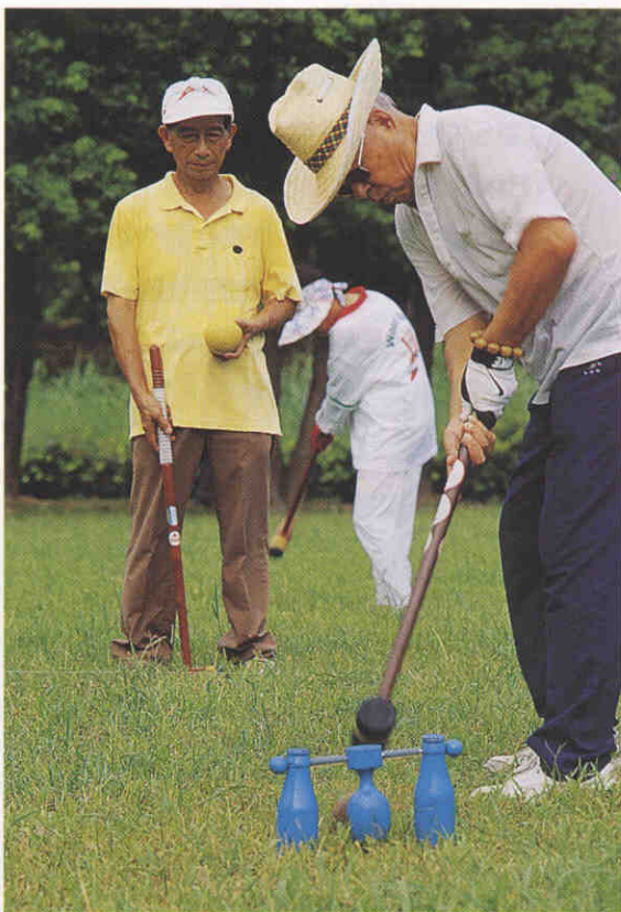
▲老人槌球運動可增進銀髮族的生活品質。

第二階段之訪視於91年12月18日~21日於南投縣政府及草屯鎮進行，12月18日邀請與會人員包括教育局副局長、體健課課長、體健課員黃年億老師及三位受表揚之代表，此次會議之重點在於分享他們所推動的活動內容及經驗，12月21日則進行實地訪視及社區民眾訪查，其內容分別為：