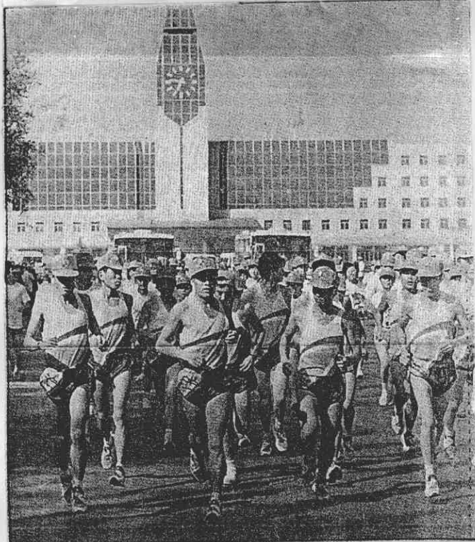
↑甫落成的唐山火車站造型優美，這裏是唐山站長跑的折返點。