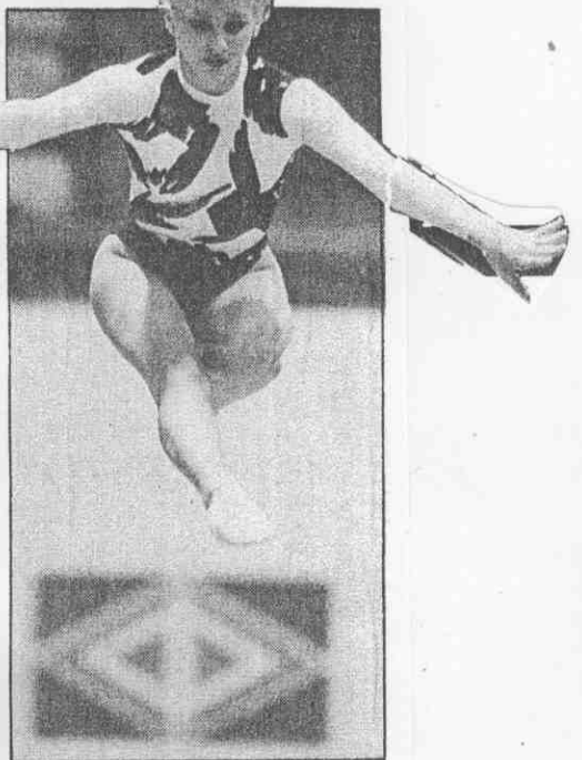
↑烏克蘭古蘇的跳躍、舞蹈、韻律都屬一流動作。