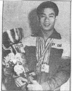
↑李寧是大陸躍上世界體操巔峰的靈魂人物。

把大陸男體操推向體操強國的功臣，除李寧外尚有樓雲、童非、李月元等。這一輩的體操選手無異是大陸體操史上值得一書的菁英，在