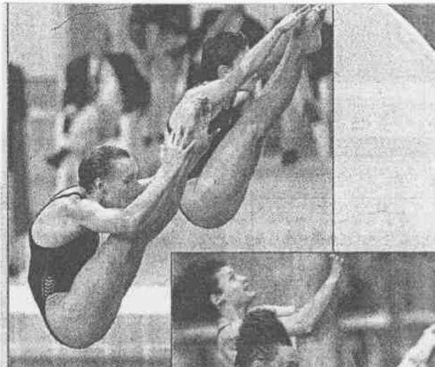
↑→俄羅斯的依蓮娜(前)／帕哈蓮娜屈體起板(上圖)、在空中屈體翻騰(右圖)的動作，掌握住雙人跳水同步、美感特質，拿下奧運史上第一面雙人跳水金牌。

雙人跳水賽還有28日的女子十公尺雙人跳台以及男子三公尺雙人跳板兩項決賽。(相關新聞見B3)