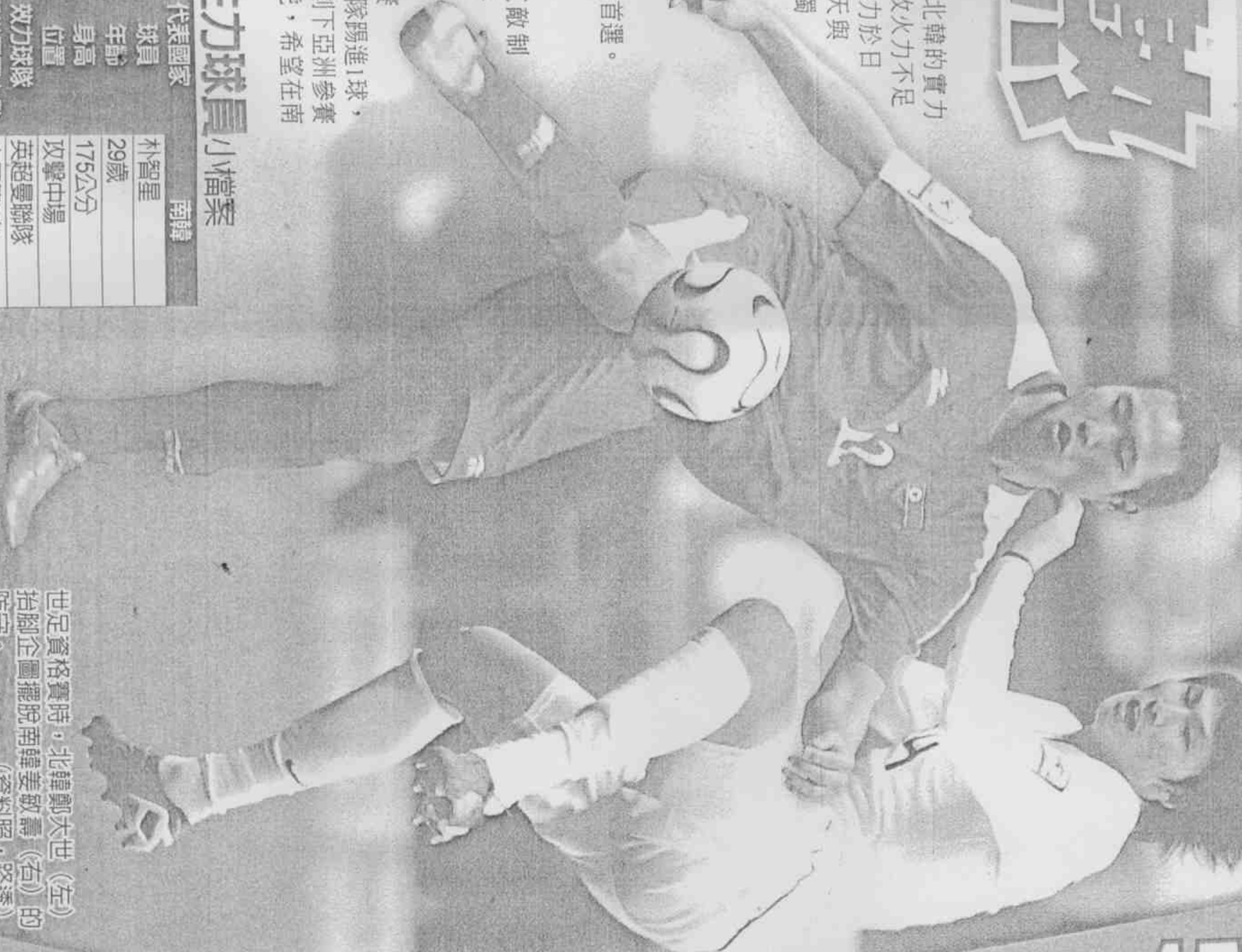
世足資格賽時，北韓鄭大世(左)的抬腳企圖擺脫南韓姜敏壽(右)的防守。