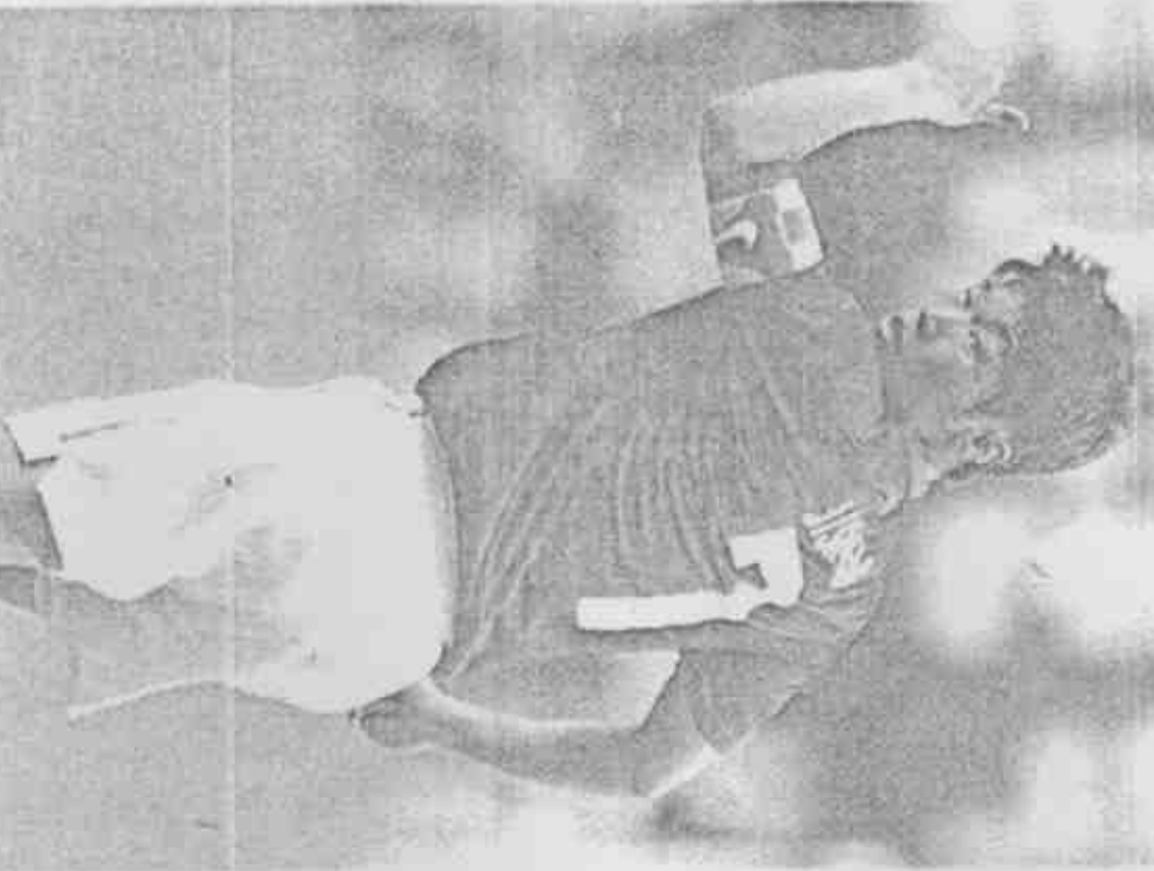
南韓國家隊的隊長朴智星，效力於英超曼聯隊，是此次南韓隊的靈魂人物。