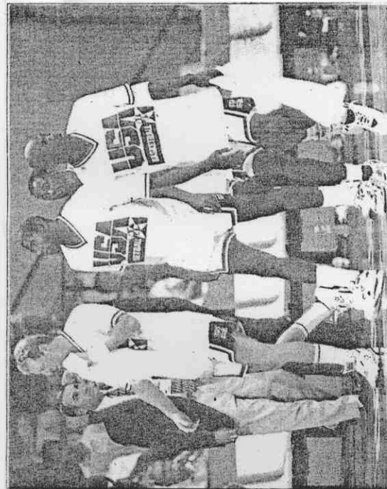
↑「大鳥」柏德（左一）和「魔術」強森（左二）退出 NBA，是球迷最大的遺憾。 ←沙馬瑞奇今年毀譽參半，但巴塞隆納奧運的成功無疑是他生命最光榮的一刻。全運照片