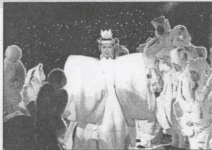
↑一名日本公主打扮的舞者參加里耳哈默冬運閉幕典禮壓軸戲的演出。

另外，長野縣民普遍不會說英語也將是他們想要辦好冬運的一大障礙。而由於日本經濟從前幾年開始陷入蕭條，使原本不是問題的經費預算，如今也是一大難題。籌備當局預估，長野縣為興建所有比賽場地與設施而背的財政赤字將高達二千億日圓，在冬運結束後，他們在未來十五年將必須每年設法償還兩百到三百億日圓。