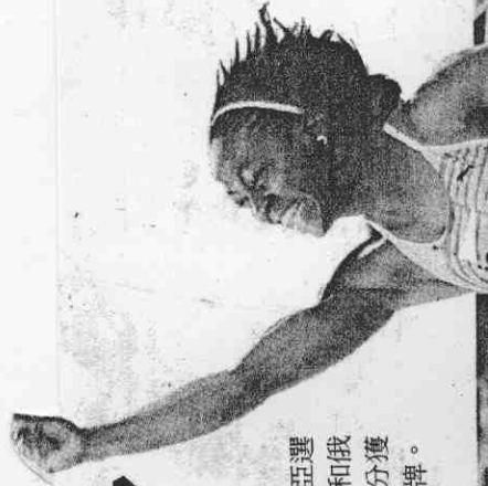
奧運女子百米率先買加的弗雷澤率先衝過終點，成為世界女飛人。