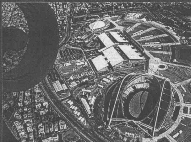
↑大陸赴希臘雅典取經，所有場館、新聞中心、選手村或是電視中心，都是參訪的行程之一。