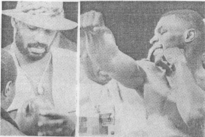
◀ 重量級拳王泰森(左)與挑戰者史賓克斯(右)在二十六日展示拳頭並挑選合適的拳套。