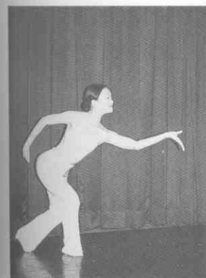
(圖 2-9) 托掌式 (一)