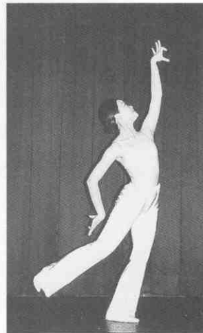
(圖 2-12) 飛翔舞姿