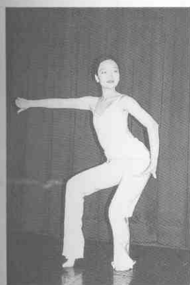
(圖 2-5) 平展翅 (單手)