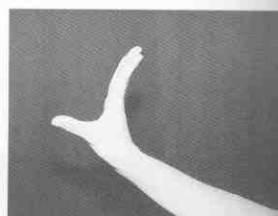
(圖 1-2) 立掌式