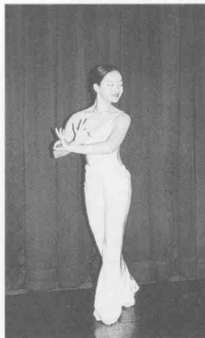
(圖 2-11) 雙抱翅