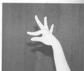
(圖 1-6) 葉式