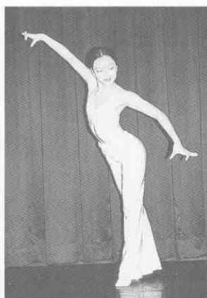
(圖 2-2) 三道彎體態 (二)