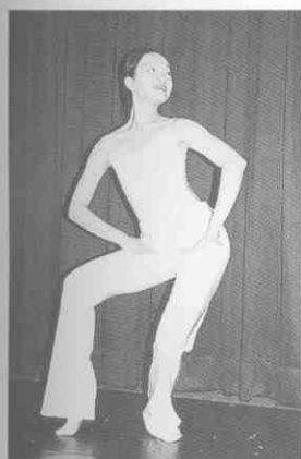
(圖 2-1) 三道彎體態 (一)