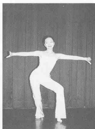
(圖 2-6) 平展翅 (雙手)