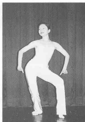
(圖 2-4) 低展翅 (雙手)