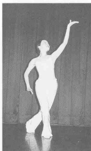
(圖 2-10) 托掌式 (二)