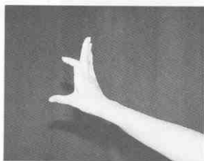
(圖 1-3) 爪式