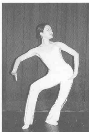
(圖 2-3) 低展翅 (單手)