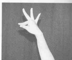
(圖 1-4) 嘴式