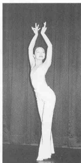
(圖 2-8) 亮翅