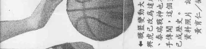
職籃變動大，中虎虎已改爲進攻易面，泰瑞戰神也有易面手傳成歷史。

職籃在這一年是變化的年，但能否「變則通」，帶動職籃真正職業化前進，仍有待時間的考驗。(林幼英)