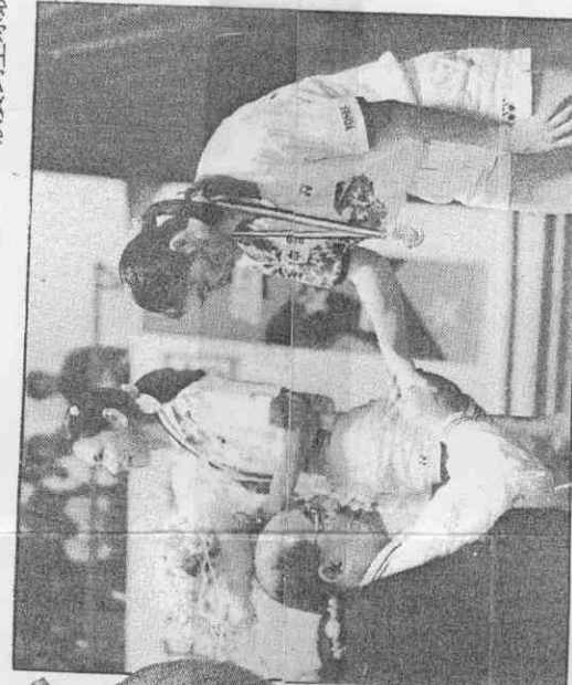
職籃變動大，中虎虎已改爲進攻易面，泰瑞戰神也有易面手傳成歷史。

職籃在這一年是變化的年，但能否「變則通」，帶動職籃真正職業化前進，仍有待時間的考驗。(林幼英)