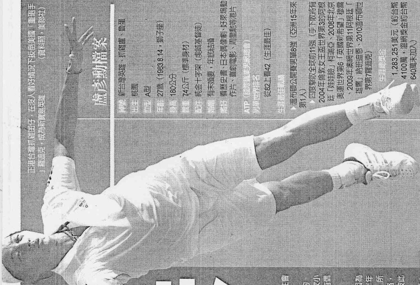
正港台灣抓雞團仔，在沒人看好情況下扳倒美國「重砲手」羅迪克，成為新寶島英雄。