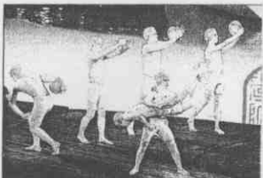
會奧運回到雅典老家，演出者巧扮古希臘時期運動員請景。