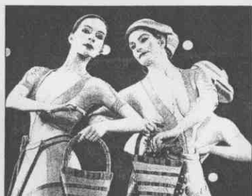
會場演出的開幕式舞者，各自扮成不同時期的古希臘女子。