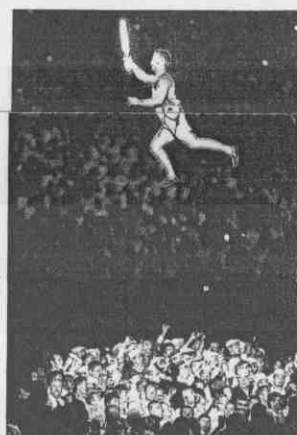
會天使漫遊星空，各國運動員歡呼揮手。