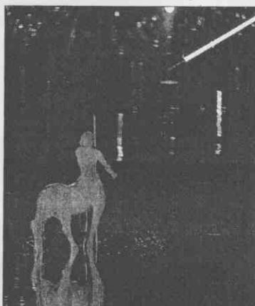
會人馬射出閃耀光芒的標槍，挑起歷史、文明、人類與夢想起源。

繼著蔚藍愛琴海和奧林匹斯精神，雅典奧運開幕式昨天奏出神話與史詩之歌，歌頌人與文明進程，讓今舉世驚嘆。 奧運始於古希臘，自第一屆現代奧運於雅典舉行以來，歷一百零八年，終在廿八屆重回雅典老家。 開幕式在奧林匹克主體育場舉行，但體育場竟變成海洋，巨大人面像浮現，化成人體和幾何形體；天使、精神、哲人、英雄引領人們重溫各時期文明，古典與現代交織，字母在DNA星雲中走入銀河，此後包括中華健兒在內的各國代表團進場。 開幕式出自英國製作人羅易維之手，製作群多達八百五十人。羅易維說，開幕式旨在「以充滿古老傳統的現代國家展現希臘」，這是她今生最重要也最漫長的三小時，但她選擇接受開幕式考驗。 奧運聖火已燃，全球一萬零五百名運動員，現已在此文明搖籃之地競技，大會將於廿九日閉幕。 文/伍聯德、王麗娟 「雅典奧運圖片精華」網上聯合新聞網 ( http://udn.com )