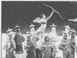
會女神在象徵古希臘的場景中擊弓。