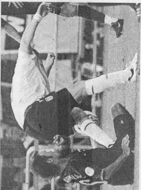
就是這一腳！英格蘭魯尼在場上踹了葡萄牙隊卡瓦略(左)的重要部位，吃紅牌被罰出場。