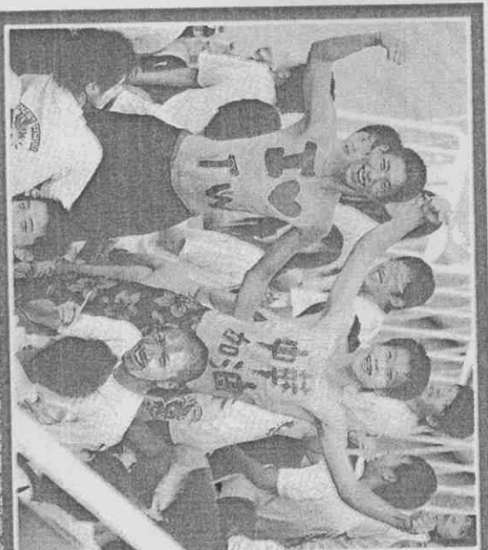
數名民衆17日在高雄創大體育館觀賽台歡分組賽，身上塗滿加字隊為中華隊加油。