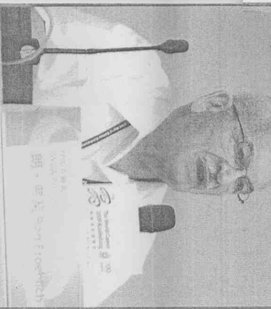
國際世界運動總會會長朗弗契17日讚賞高雄世運開幕傑出(excellent),並認為高雄世運的精彩演出將成為未來世運會的標竿。(中央社)