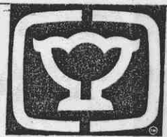
中星台維斯杯網賽