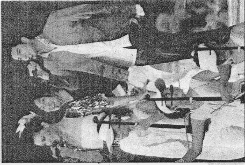
↑王力宏(右)和大陸藝人在閉幕晚會上演唱。特派記者鍾豐榮／北京報導

眾介紹袋子裡的「聲光道具」，並讓觀眾一一試用，九萬支寶郎鼓咚咚的響聲，懾人心神。 接著主持人又請觀眾拿出聖火手電筒，看台上頓時現出點點紅光，再加上扇子揚起來的一片橘色海洋，都在節目正式開始前，帶起了一波高潮。也為後來的節目，布置了特別的背景。 除此之外，經過了三個星期的奧運，大陸觀眾也開始學會「自己找樂子」，例如在節目開始前，坐在東面的觀眾，發動了波浪舞，一路向北延伸，雖然沒有轉成一圈，但還是讓現場觀眾互告到不行。