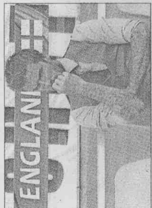
「貝帥」貝克漢在旁觀戰險色凝重，所幸最終英格蘭一一比〇擊敗斯洛維尼亞。

英格蘭在世界杯歷史上小組賽階段的最後一場比賽中只輸過一次，此後他們在小組賽最後一戰中從未失利。