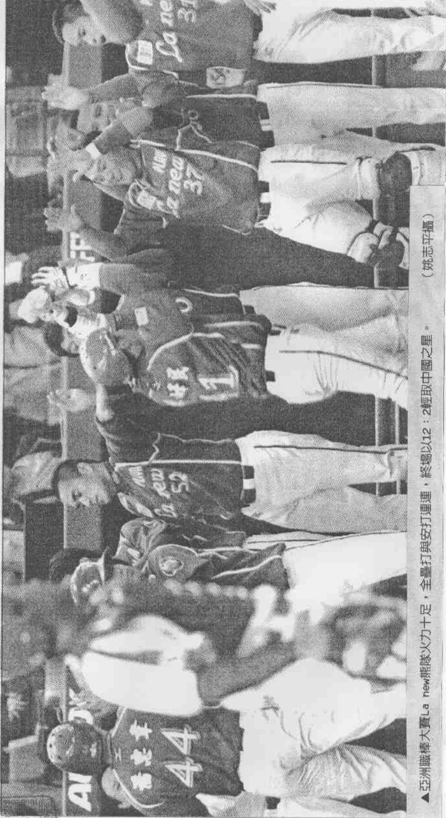
▲亞洲職棒大賽La new熊隊火力十足，全壘打與安打連連，終場以12：2輕取中國之星。

雷鵬本季戰績16勝5敗，防禦率1.94，雖成績突出，但季末出現威力下滑現象，且在總冠軍擔任第2戰先發投手，只投2又3分之2局就因失4分提前下場，今天能否投出球季初的水準，教練團也沒把握。據推測，火腿隊派武田勝擔任今天對熊隊可能性最大。