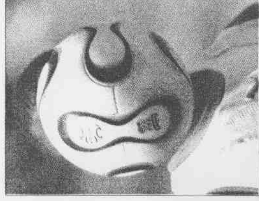
▲多哥球員練球時球剛好擋住臉龐。多哥無緣前16強。

某世足新聞發言人說：「問題大條了，罷賽牽扯到門票和電視轉播這塊攸關經濟利益的範疇；門票是可以原價退還給球迷，不過電視轉播的合約損失就難算了，還會衝擊整個世界盃。」