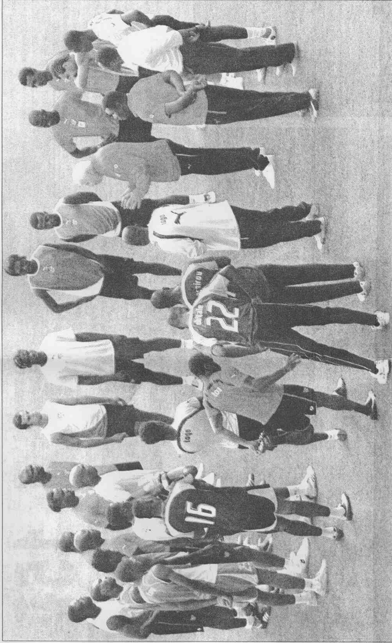
▶來自非洲的多哥隊，為了錢可以不上場打球，如此球隊怎寄望在世足賽有好成績。