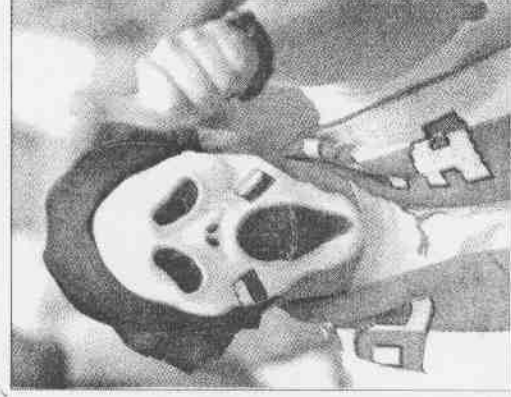
▲載著驚聲叫面具的波蘭球迷，為球隊助威。