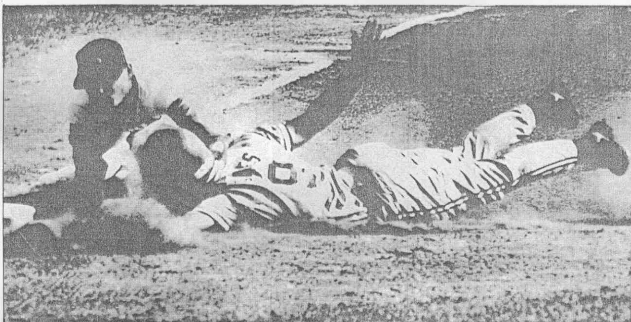
↑7局上半，美國隊⑨蓋特斯(右)盜三壘，遭古國謙觸殺出局。