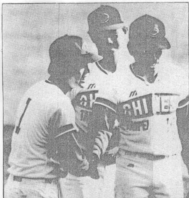
9局上美隊無功而返，終場中華隊以10:7獲勝。

此役中華隊擊出13支安打，黃忠義、羅國璋各有4支，其中黃忠義有3個打點，表現最佳，3位投手中，「郭李」被擊出3支全壘打失掉5