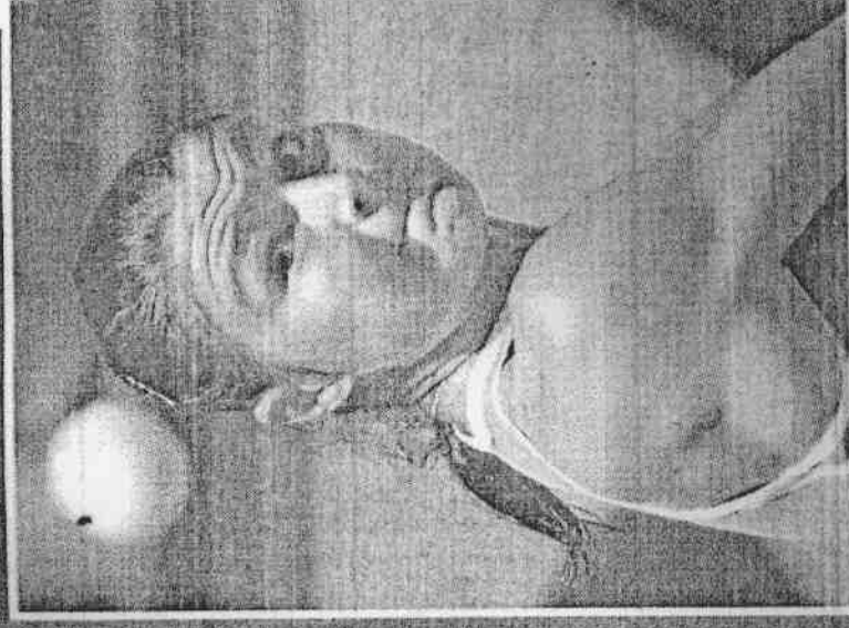
左圖：球后沙菲娜以2：1擊敗白俄羅斯對手，朝向生涯首座法網女單冠軍邁進。