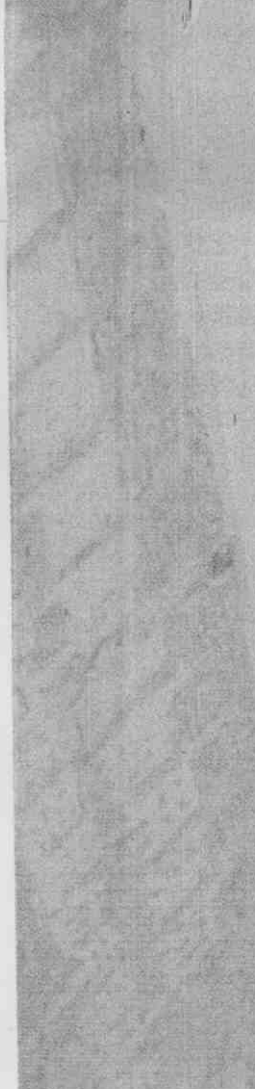
資料來源：極限運動協會網站 整理／馬廷龍 聯合報