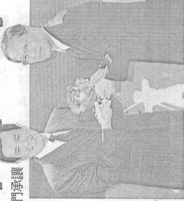
▲運動精英獎23日舉行頒獎典禮，馬英九總統（左）特別頒發終身成就獎給致力於體育教育的邱金松（右）。

在廣州亞運個人公路賽奪金的自由車好手蕭美玉，則獲選為寶島體壇的年度「一姊」。她在最佳女運動員獎遭遇勁敵曾雅妮，經過3輪票選才順利勝出，曾雅妮前年已經拿過這個獎項。