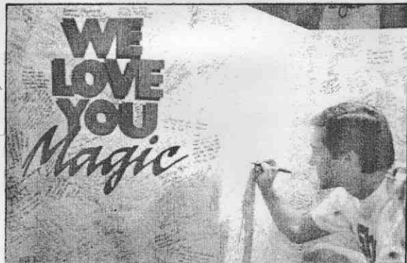
↑ 鳳凰城球迷在獲悉強森因愛滋病退出NBA後，發起「強森—我們愛你」簽名運動。

喬丹指出，強森打電話告訴他此事，電話是打到他的車上，他說：「我當時正在開車，當我聽他這麼說時，我的情緒和他一樣的混亂，我差一點失去控制，衝向路旁。」