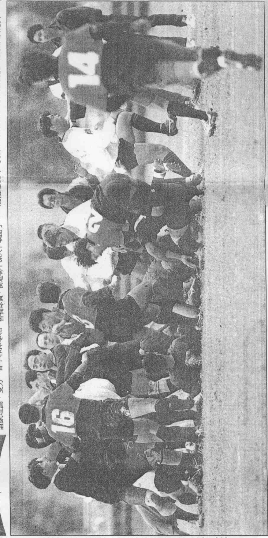
混戰 區運橄欖球冠軍戰的暴力事件，替補球員及觀眾衝進場中扭打。