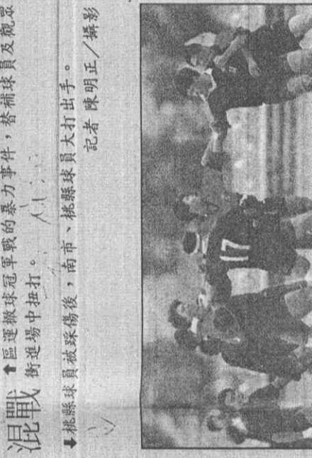
桃縣球員被踩傷後，南市、桃縣球員大打出手。