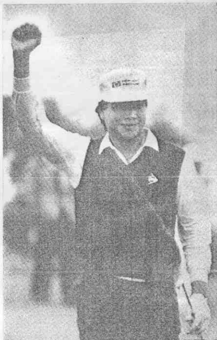
一第的賽業職內國得贏昇錦謝 。名莫奮興，軍冠個