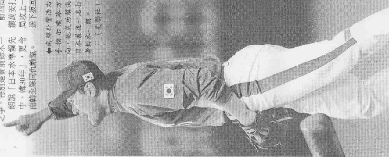
←南韓朴贊浩右手指示飛球方向，他成功解決日本最後一名打者鈴木一朗。

八局上，日本換上第四任投手石井弘高。南韓二棒李承燁一出局後揮出安打，接著李承燁轟出帶有兩分打點的個人第三支全壘打，反以3：2超前。