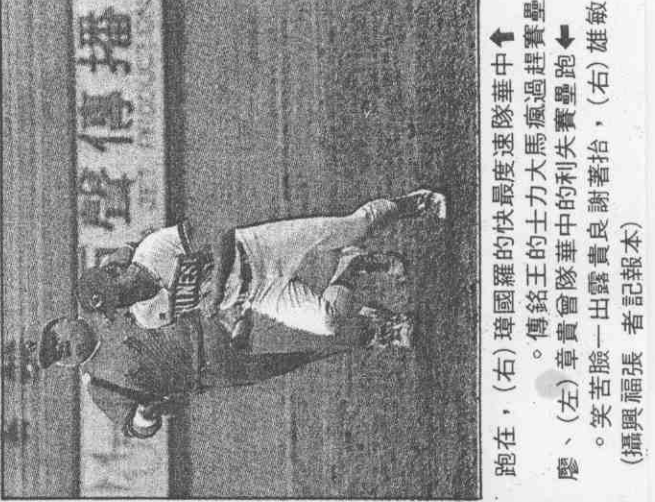
跑在，(右)璋國羅的快最速度度瘋馬過過隊隊中，(左)章貴臉一出露貴良請著抬，(右)雄敏。笑苦臉一出露貴良請著抬，(右)雄敏。