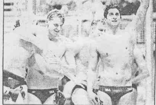
▲美國四百公尺自由式接力隊贏得奧運金牌後，在池畔慶祝。