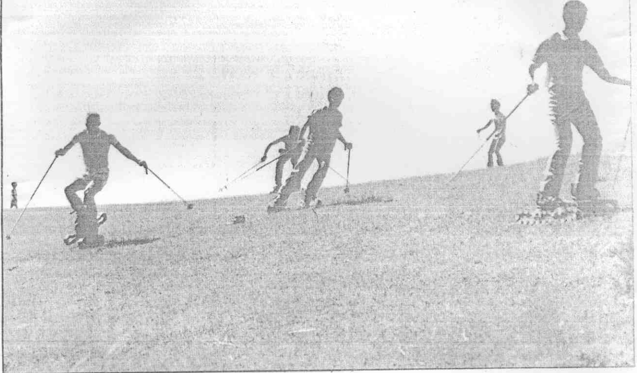
滑草運動新大陸，原草滑上明年二月，在台北，由滑草協會主辦。