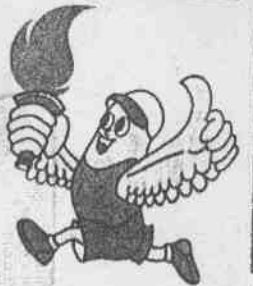
記者 姚怡萱 特稿