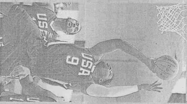
美國漢尼攻守俱佳拿下「大三元」。

中國隊能夠讓美國隊飽受威脅，主要是有效變換盯人與區域防守，加上有效掌握快攻機會，全場並投進10記三分球，前3節一直將落後差距控制在10幾分之間，直到第4節才向美國隊強勢禁區