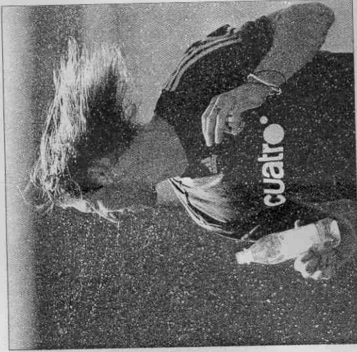
►西班牙隊後衛拉莫斯練球時以冰水降溫。門生士今晚首戰烏克蘭。