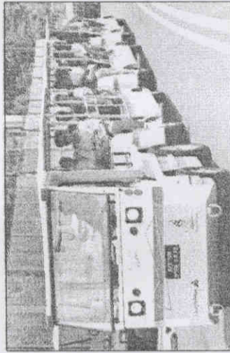
◆選手村內設聯接車載送選手。