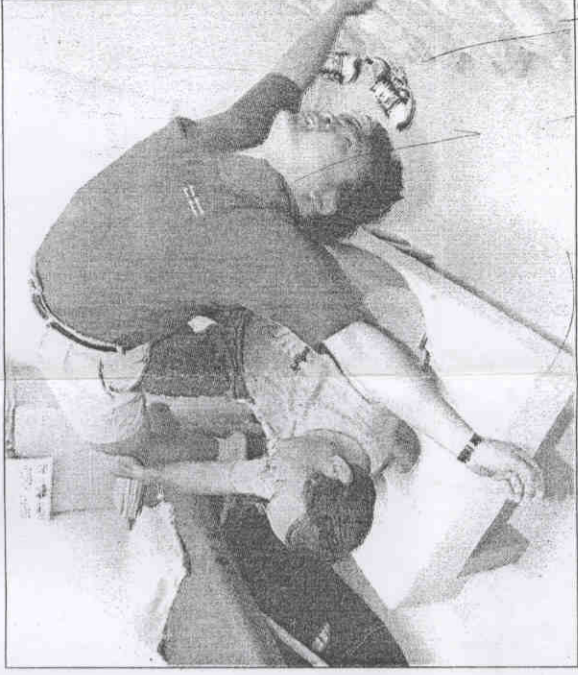
◆我國奧運代表團在選手休息區內設置按摩設備，供選手休息使用。