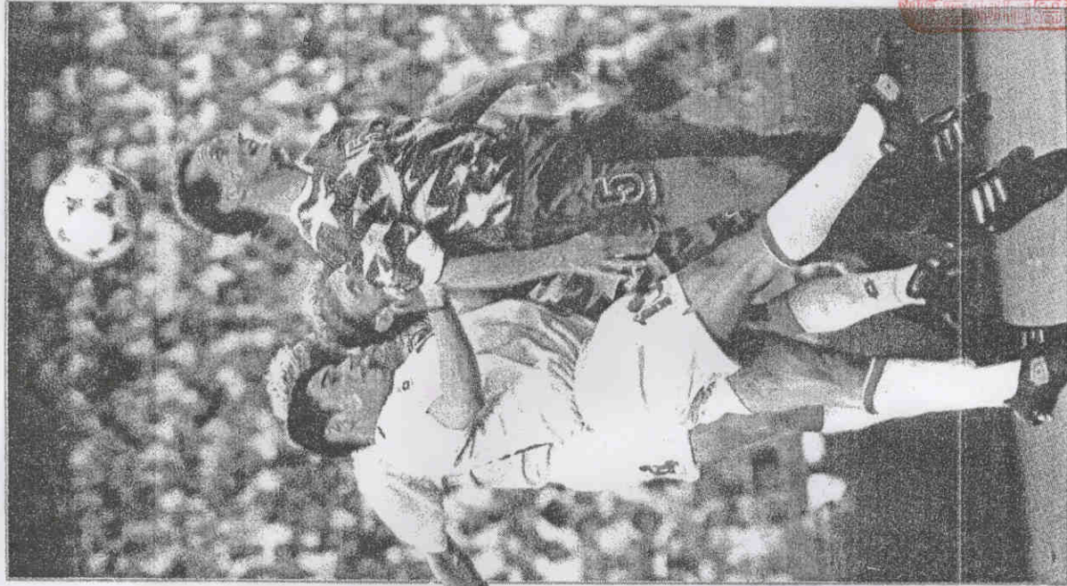
稱這場比賽是「沙奇大災難」。

雙方最近六次交手中，愛爾蘭從未贏過。而義大利這次首戰敗陣，已使全國陷入一片愁雲慘霧。許多人在看完比賽後，都抱頭痛哭。翌日各大報章一片撻伐之聲，讓義大利教頭沙奇面臨更大的壓力。一家報紙