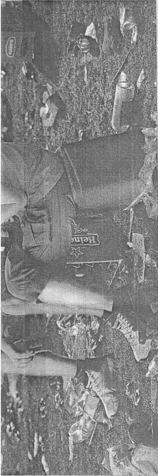
▲在阿姆斯特丹廣場前觀戰的荷蘭球迷，目睹球隊失利後，難過得落淚，遲遲不肯離去。(路透) ◀荷蘭隊羅本的單刀被西班牙門神卡西亞斯以右腳擋出，錯失領先良機。(路透)