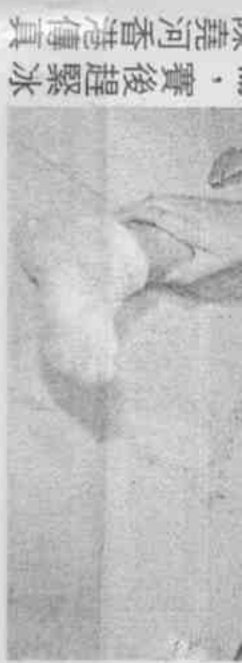
· 賽後趕緊冰 除楚河香港傳真

區· 巴和米」了牛糞子· 甜柑與周聊中透 露· 明年有結婚的打算· 他說：「過了農 曆年· 簡毓瑾虛歲就要28了· 習俗上總是 覺得29歲不宜婚嫁· 應該真的要準備 了！」明年將是這對羽球戀人愛情長跑第 9年· 可望有情人終成眷屬。