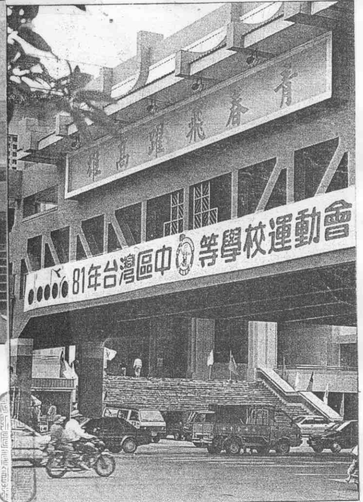
↑區中運各項準備工作已就緒，港都重要街道處處可見宣傳看板。