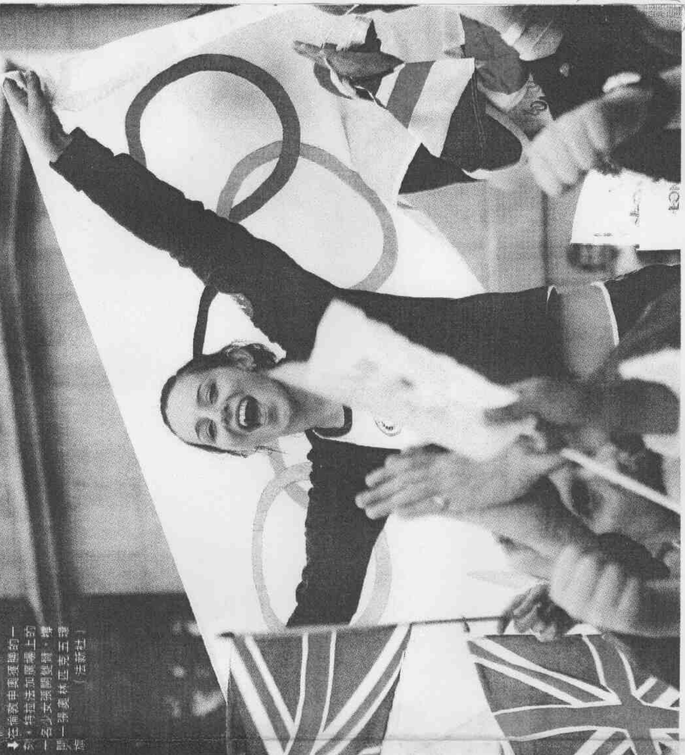
在倫敦申奧獲勝的一刻，特蕾莎·梅在溫布頓的一場一級賽網球賽中，揮舞英國國旗。（法新社）