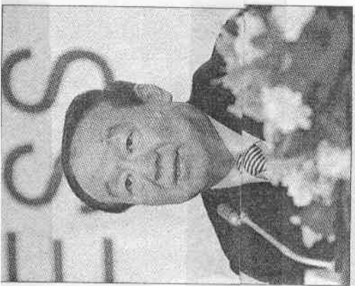
北京奧組委執行副主席蔣效愚昨晚在記者會上表示，是台灣商團方面終止會談，關閉協定大門。

【特派記者汪莉網／北京報導】北京奧組委昨晚七時舉行記者會，公布兩岸協定奧運聖火來台所有過程。執行副主席蔣效愚表示，中華台北奧會主席蔡辰威前天來函，表明不再與北京奧組委進行聖火入台協商，單方面終止會談，關閉協定大門；當晚，國際奧會通知北京奧組委，取消聖火傳遞入台。