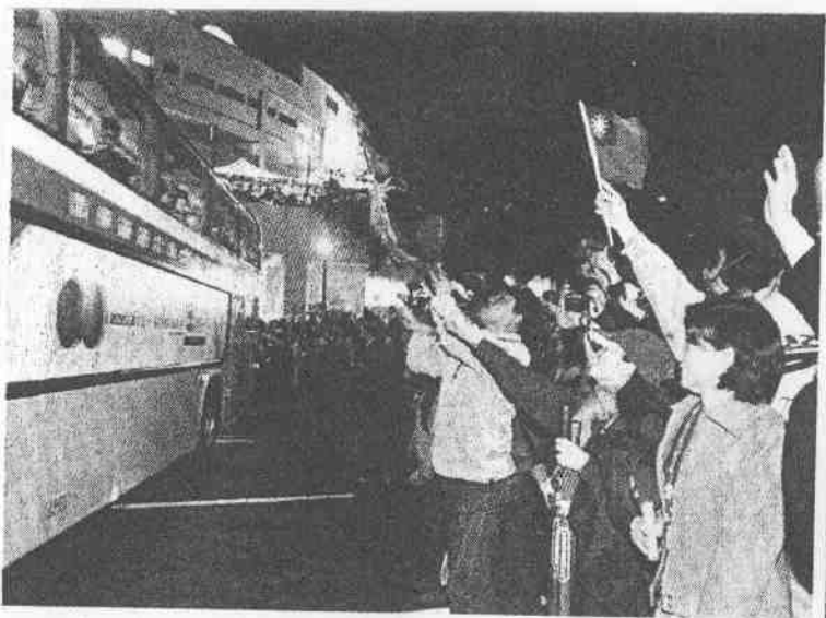
球送歡，員球勵鼓旗國舞揮仍迷球忠死是但，球了輸然雖隊華中